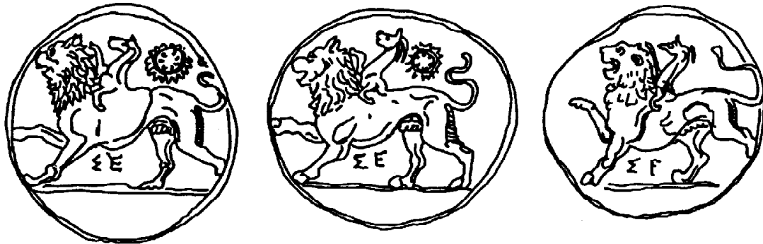
Fig. 3 - Tre monete d'argento provenienti da Sicione, nel monetiere del Museo Archeologico di Firenze. Mostrano la Chimera con la coda di serpente nella giusta posizione. Da sinistra a destra: inv.n.35705, inv.n.35703, inv.n.35704.

e nelle vene rilevate, rese con calligrafico realismo, del corpo teso del leone) e di stilizzazione (nella testa con fauci spalancate in atto di feroce aggressione e nel pelame della criniera e del dorso, reso con ciocche dette convenzionalmente “a fiamma”); di conservatorismo (negli elementi convenzionali arcaizzanti della testa e della criniera) e di intensa espressività (nell’aggressività feroce del muso del leone e nel patetico abbandono della testa della capra).