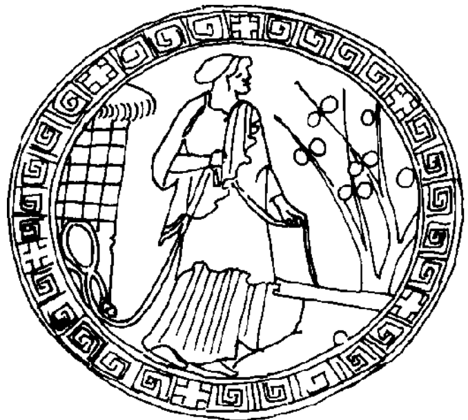
Fig. 2 - Kylix. Firenze, Museo Archeologico n. inv. 76103. Pittore di Brygos. 490-480 a.C. circa. Donna al pozzo

Nei percorsi di approfondimento introdotti dalla presente Scheda 4 proponiamo una selezione di immagini vascolari conservate nel Museo Archeologico di Firenze che illustrano aspetti e momenti significativi della vita di tutti i giorni dell'Atene arcaica e classica: l'importanza della musica e del canto (v. C4-1; Dia 1-12 ) e degli esercizi sportivi (v. C4-2; Dia 13-23 ) quali momenti significativi dell'educazione e formazione del cittadino maschio di una pòlis greca, il banchetto quale rituale collettivo e specchio fedele di una società nella quale i maschi adulti si associano in raggruppamenti (eterie) sulla base della comunanza di sentire politico e aspirazioni culturali (v. C4-3; Dia 24-29 ), la difesa in armi della pòlis (v. C4-4; Dia 30-37 ) e la dipartita dal mondo dei vivi (v. C4-5; Dia 38-39 ), l'ambiente urbano che fa da sfondo all'agire umano (v. C4-6; Dia 40-44 ) e il mondo esterno alla pòlis attraverso il quale si passa (v. C4-7; Dia 45-49 ), infine le forme attraverso le quali gli uomini e le donne si mostrano all'esterno, capaci di far balenare immediatamente differenze di età, di sesso, di ruoli e di funzioni (v. C4-8; Dia 50-57 ).