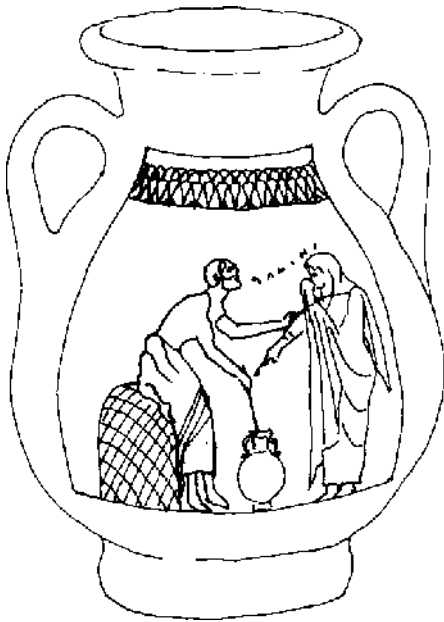
Fig. 3 - Pelike. Firenze, Museo Archeologico n. inv. 72732. Cerchia del Pittore di Antimènes. 520-510 a.C. circa. Lato A. Venditore di olio.

e andante che sembra voler rispondere alla modestia del tema, il ceramografo riesce con semplicità a riprodurre l'atmosfera di un ambiente domestico: la vera del pozzo costituita dalle pareti spesse di un grosso orcio verosimilmente segnato e sfondato, l'albero carico di frutti, la corda (si noti che una delle due estremità appare rinforzata da un triplice nodo), il muro in mattoni crudi del cortile di casa protetto in sommità da uno strato di paglia.