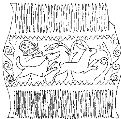
Fig. 2 - Doppio pettine

Impressa sul listello superiore della cassa prima della cottura, quando l'argilla era ancora cruda, l'iscrizione indica il nome della defunta, o forse il nome del personaggio che commissionò il sarcofago, senza poi usarlo. L'iscrizione, in effetti, risultava, al momento della scoperta, parzialmente riempita e ricoperta da uno strato di stucco (alcune lettere sono ancora mal leggibili) sul quale era stato dipinto un secondo nome, diverso dal primo, oggi quasi completamente scomparso. Poco chiaro per questo il reale rapporto tra la defunta seppellita nel nostro sarcofago e gli altri personaggi sepolti nella stessa tomba, sicuramente pertinente alla famiglia larcna (3).