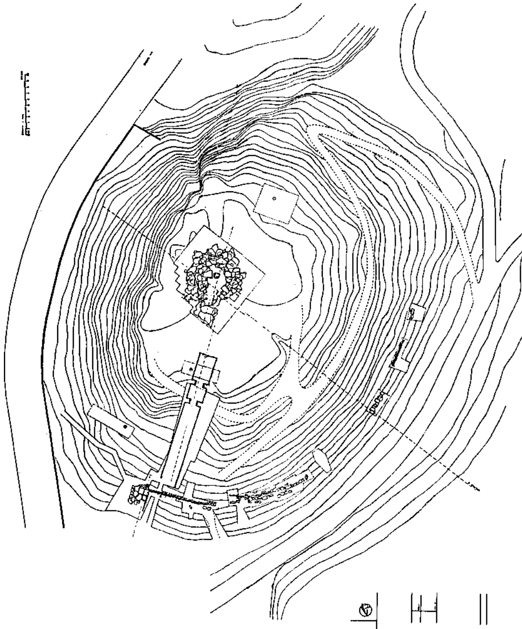
Fig. 2 - Tumulo di Montefortini: si notino a nord la Tomba 1 (v. fig. 3) ed al centro la Tomba 2. Si notino, altresì, le curve di livello altimetrico.

corredi sepolcrali, che testimoniava l'avvenuta profanazione del complesso.