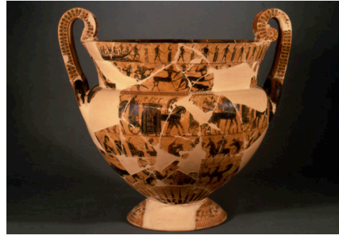
Cratere François (570 a.C.)

Le decorazioni del cratere si articolano tutte su due lati, tranne quella centrale e le scene del piede: le nozze di Pelèo e Tèti, infatti, con il corteo di divinità che giunge a rendere omaggio ai due sposi, sono ritratte su una fascia che abbraccia il punto di maggior espansione del vaso, mentre Pigmèi e Gru si rincorrono tutt'intorno al piede. Il vaso stesso, in quanto cratere, è immerso nella realtà del simposio e, in