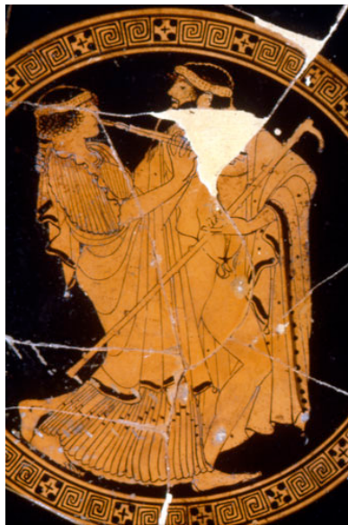
Kýlix inv. 3921, 490-480 a.C. (SALA 14)

Teògnide (VI sec. molti altri autori che menti più vari nelle l'amore è un sentimento profondo e sione per esprimerle, Dioniso che scioglie abbandonarsi alle Nel libro V dell'Anriunite le poesie erodall'amore per l'etèzare, a quello dell'amore per un raper caso al mercato; to invece esclusiva-omosessuale e ancomposio è il luogo elettra amanti.