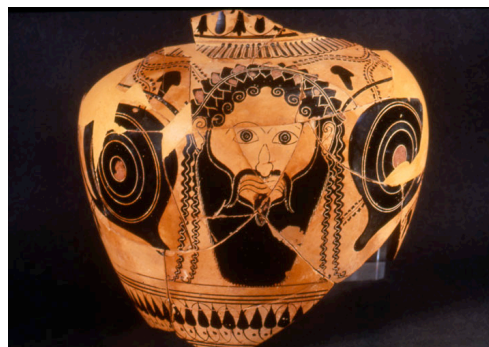
Anfora (inv. 141802), fine del VI sec. a.C.

Il dio del vino, figlio di Zeus e della mortale Semèle, non è quasi mai raffigurato in qualità di simposiasta (ma vedi l' òlpe inv. 3816 e l'anfora inv. 3812 , ambedue in SALA 13 ); per lo più lo troviamo in compagnia di satiri e ménadi, il suo corteggio fatto di personaggi semiferini o di donne dall'atteggiamento sfrenato. In SALA 13 troviamo su di un'anfora (inv. 3826 ) a figure nere la scena più tipica del dio tra i satiri. Un kànt-haros o un corno potorio sono i suoi attributi più diffusi, la veste lunga, la barba e spesso una corona di edera completano il personaggio che dona il vino agli uomini e ne regola la coltivazione e la lavorazione. È Dioniso, in una commedia di Eubùlo , a dettare le norme del giusto bere, consigliando il numero di crateri da vuotare durante il simposio.