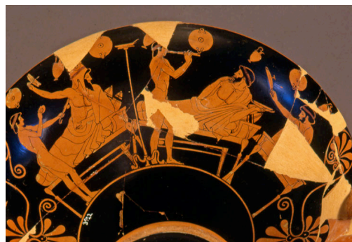
Kylix inv. 3922 (480-470 a.C.)

Vi sono ceramografi, infatti, che tracciano sulle loro opere chiari apprezzamenti per la bellezza di alcuni giovani, forse efèbi noti nell'Atene del tempo: il nome del ragazzo è associato all'aggettivo kalòs che ne indica la bellezza fisica e morale. La decorazione di una coppa (inv. 3922) nella SALA 14 non lascia dubbi: il pittore è Douris , famoso ceramografo del primo quarto del V sec. a.C., che rappresenta sulla superficie esterna una scena di banchetto, con sei convitati disposti su klinai . Sono sdraiati ognuno su di un letto e sorprende vedere che tra di loro vi è un orientale dal caratteristico copricapo; i