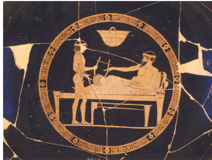
Kýlix (inv. 3946) a fig. rosse, 460-450

strumento appeso alle spalle dei simposiasti a evocare la fondamentale presenza della musica.