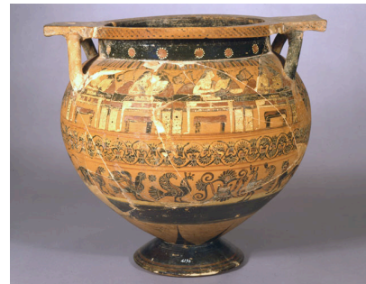
Cratere a colonnette (inv. 4198). 575 - 550 a.C.

Il cratere a colonnette tardo-corinzio (inv. 4198 ) datato tra il 575 e il 500 a.C. raffigura ben quattro klìnai con un uomo e una donna distesi su ciascun letto: si tratta di una decorazione a figure nere con un uso del colore bianco per indicare non