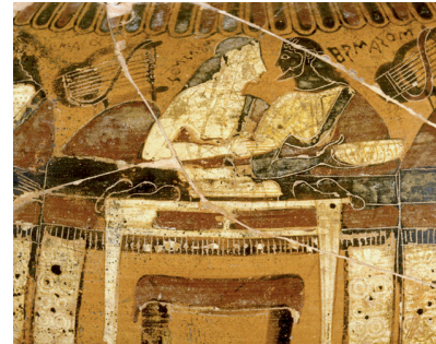
Cratere a colonnette inv. 4198 (575–550 a.C.)

Il Cratere François (inv. 4209 ) campeggia al centro della SALA 11 : l'opera del vasaio Ergòtimos e del pittore Kleitias (datata intorno al 570 a.C.) può essere ammirata solo girando intorno alla sua circonferenza e seguendo le tante storie raffigurate sulla superficie. Le didascalie, scelte opportunamente dall'artista per