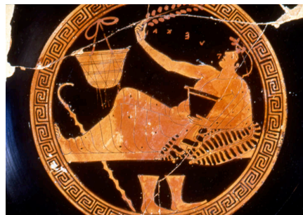
Kýlix (inv. 3949) a fig. rosse, 490-480 a.C. Particolare del tondo interno

di argomento elevato – e meno sferatezza rispetto agli strumenti a percussione: nel tondo interno di una kýlix a figure rosse (inv. 3946) in SALA 14 un simposiasta afferra la lira che gli porge un giovane servo. La scena sembra quasi un momento isolato dal contesto più ampio del banchetto che si svolge sul lato esterno della coppa: quattro klinai e un giovane che serve i convitati, tutti uomini sia maturi che efèbi.