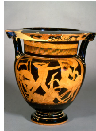
Cratere a colonnette (inv. 3997) Pittore di Firenze (470-460)

Fra i vasi del Museo Archeologico questa scena si ripete non solo sul vaso François, ma anche su un cratere a figure rosse in SALA 14 (Inv. 3997 ): eponimo del Pittore di Firenze , il vaso è datato 470- 460 a.C. e raffigura un momento di lotta concitata. L'inciviltà dei Centauri, già evidente nell'ubriachezza aggressiva e sfrenata, è sottolineata dal tipo di combattimento che ingaggiano contro i Lapiti; i Centauri infatti utilizzano tavoli e vasi oppure grossi massi, armi non convenzionali e anzi, in qualche caso, gli strumenti stessi del banchetto che vengono snaturati da chi – lontano dalla civiltà – non ne comprende il senso.