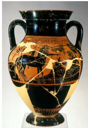
Anfora a figure nere (inv. 3812) 520-510 a.C.

Il cattivo rapporto dei Centauri con il vino è ribadito in un episodio della saga di Eracle raffigurato su un'anfora a figure nere (Inv. 3812 ) in SALA 13 : Eracle, diretto in Acàia (regione del Peloponnèso) verso il monte Erimànto alla ricerca del cinghiale da abbattere, giunge nella caverna di Phòlos , un centauro che, pur vivendo tra le montagne e nutrendosi di selvaggina, ha compreso il potere devastante del vino e ne tiene un pìthos nascosto e coperto nello suo antro. Eracle vorrebbe essere accolto da ospite e attingere al vino del padrone di casa, ma il centauro è restio, non vuole rischiare di attirare i suoi compagni più selvatici. Alla fine cede: la scena che vediamo colloca in un'ambientazione agreste i due convitati che utilizzano un kàntharos e un corno potorio, come in una tipica sala da banchetto; il coperchio del pìthos è già tolto ma un quadro così piacevole prelude alla tragedia inevitabile. L'episodio mitico si conclude infatti con l'arrivo dei Centauri inebriati e resi folli dall'odore del vino, Eracle ingaggia uno scontro in cui ha la meglio ma a scapito dello stesso Phòlos , coinvolto suo malgrado nella furia dell'eroe.