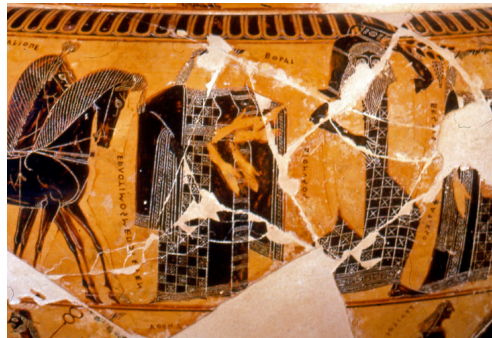
Cratere François (570 a.C.). Particolare del fregio con le nozze di Peleo e Teti: Dioniso porta il vino agli sposi.

La decorazione "a occhioni" ci introduce in un altro aspetto del simposio, scaramantico ma importante. Nel portare la kýlix alle labbra il simposiasta distoglie lo sguardo dagli altri convitati e per qualche momento è esposto agli eventuali attacchi di chi lo circonda: il gesto di bere, tuttavia, fa sì che gli occhi dipinti sul-